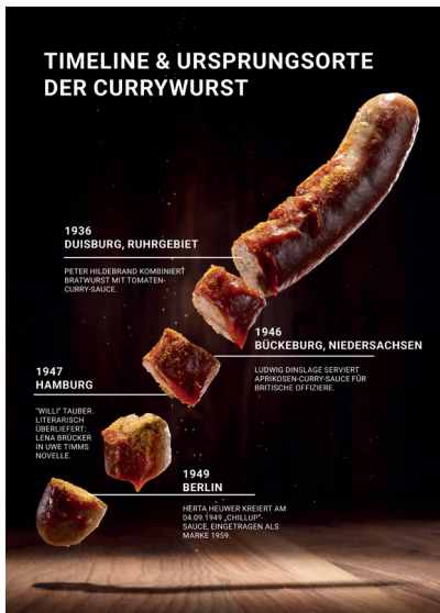
Infografik für einen Blogbeitrag