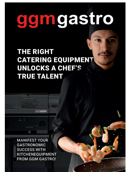
Werbeanzeige in einem Magazin