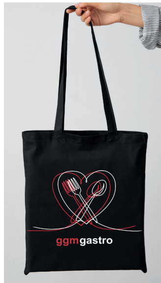
Jutebeutel für Messen