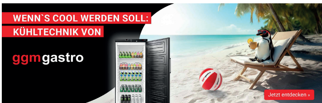
Webshopslider mithilfe eines KI-generierten Bildes